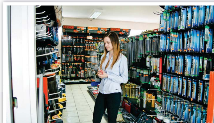
Uczestniczka projektu na stażu

W bieżącym roku nacisk położono na efektywność zatrudnieniową zaplanowanych działań oraz dostosowanie wsparcia do potrzeb zdiagnozowanych na lokalnym rynku pracy.