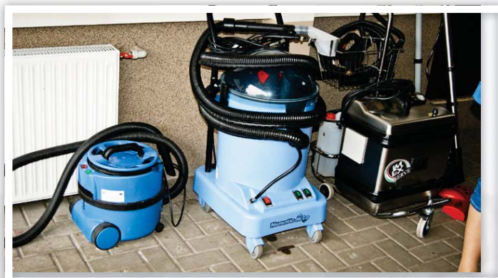
Sprzęt zakupiony w ramach jednorazowych środków na podjęcie działalności gospodarczej

Priorytet VI dotyczy aktywizacji społecznej i zawodowej osób pozostających bez zatrudnienia, w tym osób długotrwale bezrobotnych. Środki te przyczyniają się do efektywnego rozwoju gospodarki oraz pobudzania przedsiębiorczości w regionie pozwalając na kontynuację walki z bezrobociem oraz wykluczeniem społecznym.